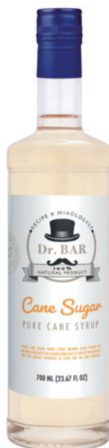
DBA01070ZC, 700ml, 6, 25