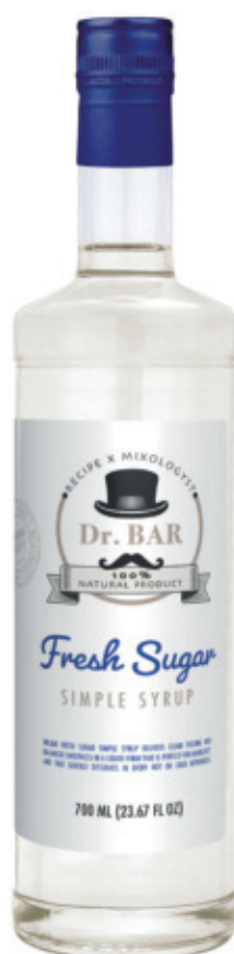
DBA01070ZB, 700ml, 6, 25