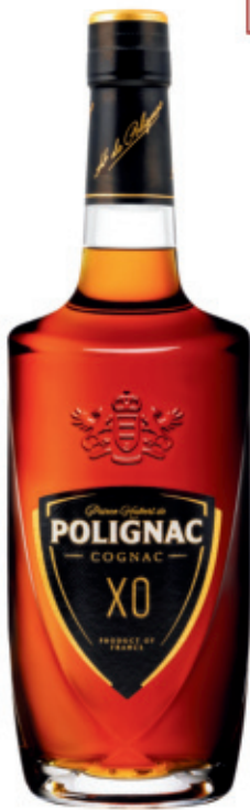
POL0307040, 700ml + Box, 6, nd