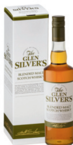
SWH0607040,700ml + Box, 6, 19