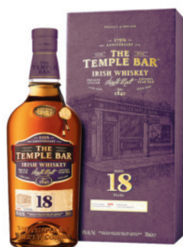
IRW0507040,700ml + Box, 6, nd