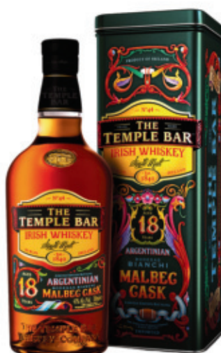
IRW0207043,700ml + Box, 6, nd