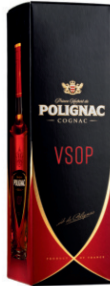
POL0107040, 700ml, 6, nd