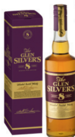
SWH0307040,700ml + Box, 6, 19