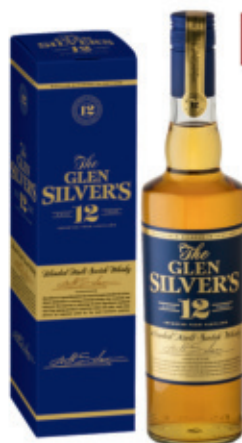
SWH0407040,700ml + Box, 6, 19