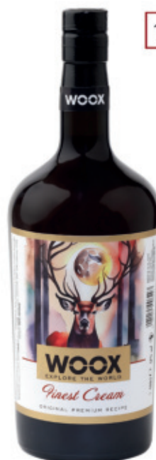
WOX0110017, 1000ml, 6, 12