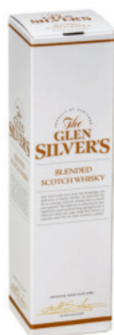
SWH0507040,700ml + Box, 6, 19