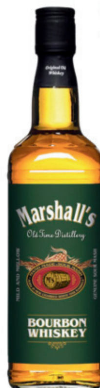
BWH0107040, 700ml, 6, 25