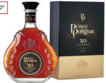
POL0407040, 700ml + Box, 6, nd