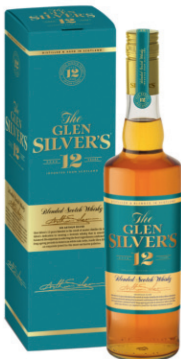
SWH0807040,700ml + Box, 6, 19