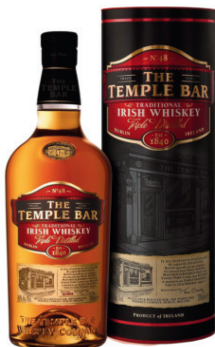
IRW0407040,700ml + Box, 6, nd