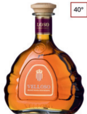
BRD0207036, 700ml, 6, nd